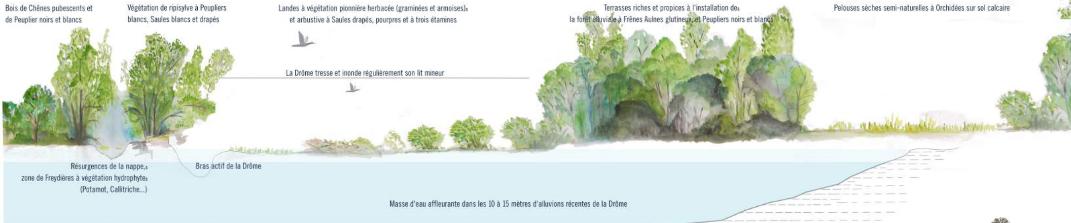
LES DESSOUS DU PAYSAGE DES RAMIERES DE LA DRÔME

Le terme Ramières désigne localement des boisements riverains des cours d'eau (ramus : branche). Selon son débit et le niveau de sa nappe d'accompagnement, les sols du lit majeur de la Drôme sont plus ou moins humides, inondés, enrichis par les limons et favorables à une végétation arborée typique des zones alluviales. Ces variations favorisent le dessin de paysages variés, structurent le relief et déterminent les espèces végétales qui y croissent. Le paysage se dessine alors par le dessous.